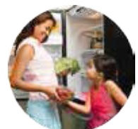
Refrigeradores, lavadoras y hornos de microondas